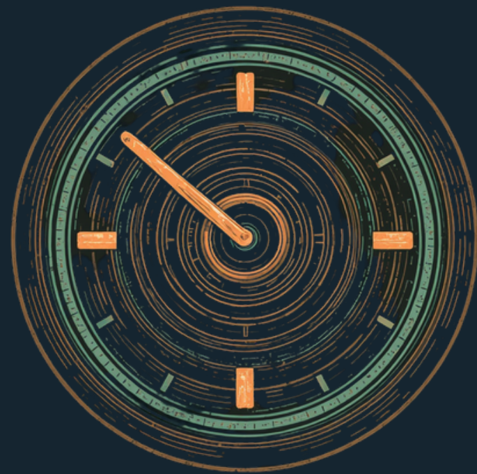
Velocidad de obturación